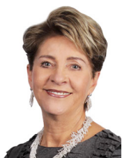
Mercedes Juan López, MD, MSc

Ministry of Health, Mexico. Medical Doctor degree from the Medicine Faculty at the National Autonomous University of México (UNAM), México City, where she specialized in Rehabilitation Medicine and graduated with honors. Dr. Juan received her MSc in Neurological Rehabilitation at the Metropolitan Autonomous University, México City. In her distinguished career has served as Health Cabinet Technical Secretary for the Presidency of México; Secretary of Health Regulation and Promotion at Ministry of Health; Federal Congresswoman of the LVII Legislature; Secretary of the Health Commission, Population and Development; Vice-coordinator of the Parliamentary Fraction for PRI; Commissioner of the Federal Commission for the Protection Against Sanitary Risk (COFEPRIS); Social Council Government committee for the National Women's Institute; Executive President at the Mexican Health Foundation. Dr. Juan López has published numerous scientific articles and books on a wide range of topics, among they are disability and rehabilitation, the role of women in health care, environmental pollution, and the modernization of health regulations in México, among others.